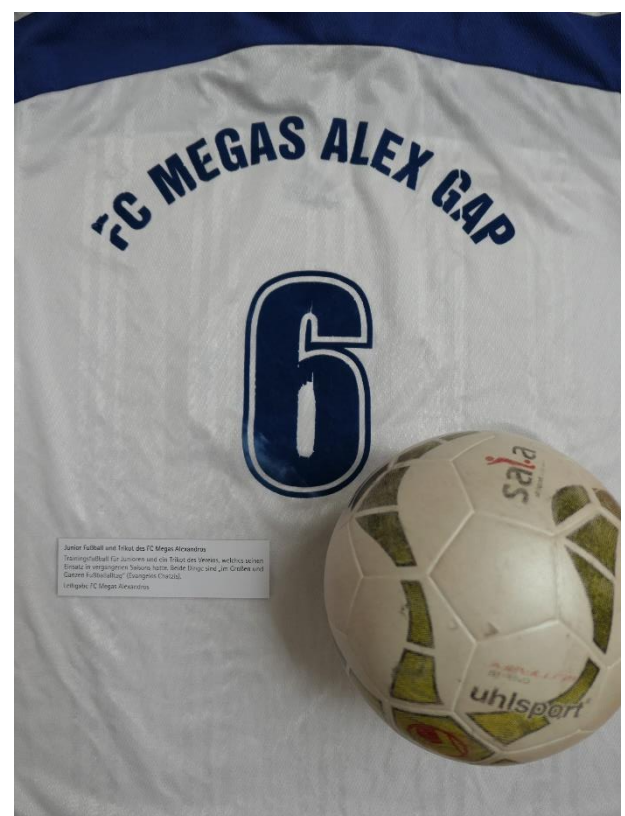
Junior Fußball und Trikot des FC Megas Alexandros

In dieser Hinsicht ist auch der Name der Mannschaft gut gewählt, da Alexander der Große im Laufe seines Lebens viele Verbündete aus aller Herren Länder in seinen Reihen hatte.“