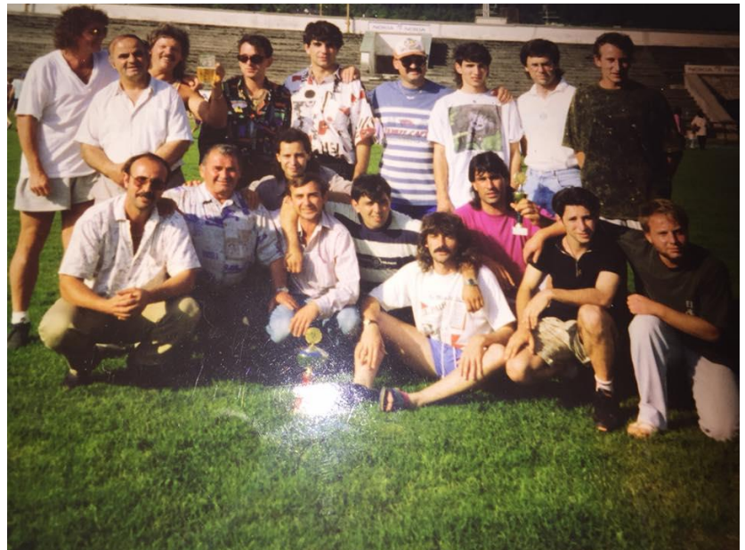
Mannschaft des FC Megas Alexandros, 1991/92

„Ich wurde am 11.06.1969 in Garmisch-Partenkirchen geboren. Meine Eltern sind 1967 aus Griechenland nach Deutschland gekommen und haben hier bis zur ihrer Rente gearbeitet. Ich fing als 8-Jähriger mit dem Fußball beim 1. FC Garmisch-Partenkirchen an und habe dort bis zum 15. Lebensjahr gespielt. Zu Megas kam ich im Sommer 1991, nachdem ich meinen Wehrdienst in Griechenland absolviert hatte. Dort spielte ich bis 2002 und wechselte dann zum TSV Farchant , wo ich noch heute gelegentlich für die Altherrenabteilung spiele. Als Megas dann 2014 einen Trainer brauchte, habe ich keine Sekunde gezögert und die Trainerarbeit dort übernommen. Mittlerweile habe ich die C-Lizenz beim Bayerischen Fussballverband erworben und mir macht die Arbeit mit den Jungs Spaß. Mannschaftssport ist für mich die beste Art und Weise, junge Menschen zueinander zu führen.“