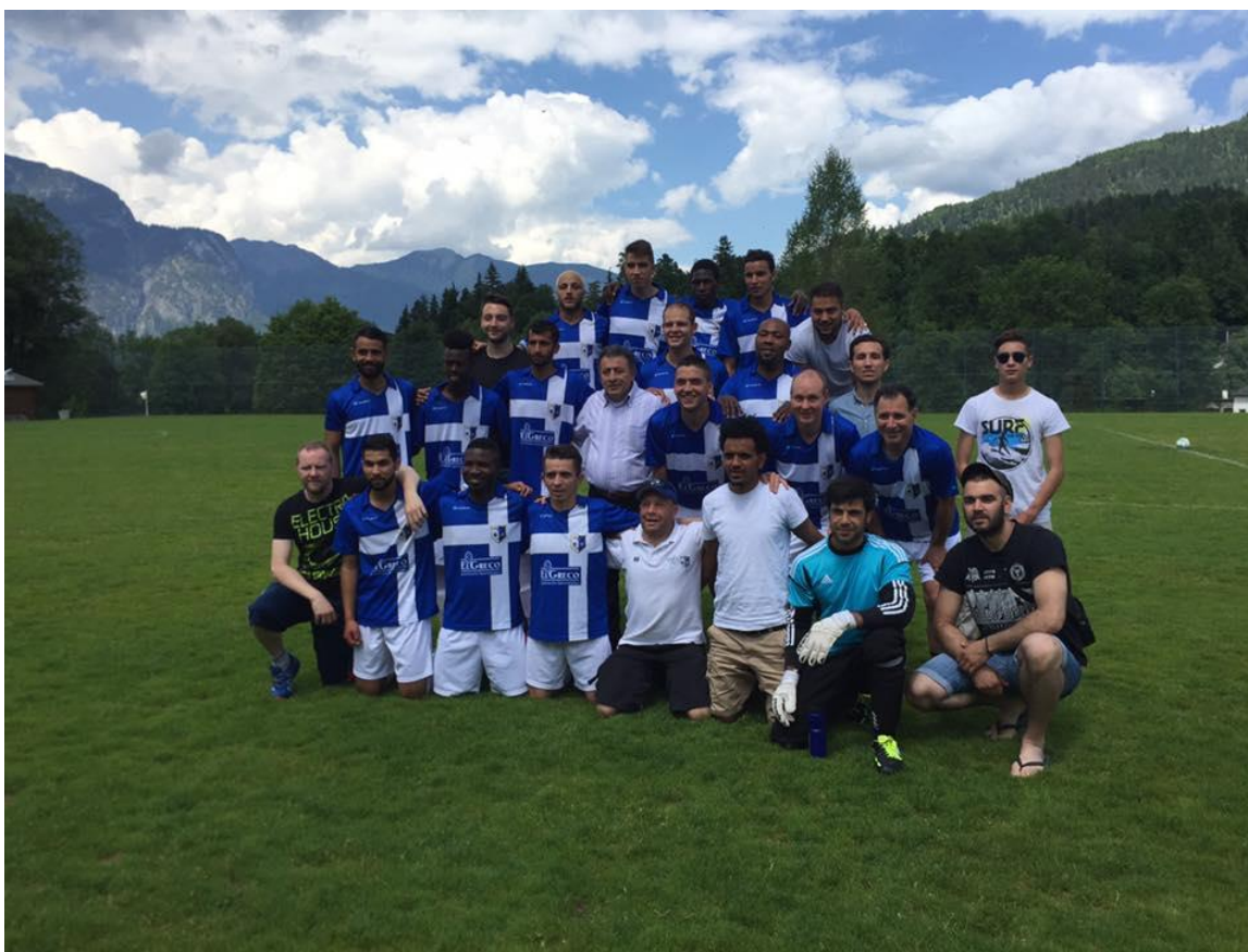
FC Megas, 2015/16