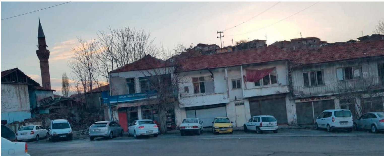
Das Viertel „Altindag“, im Zentrum Ankaras In diesem Viertel stand das Wohnhaus der Familie Balkic.