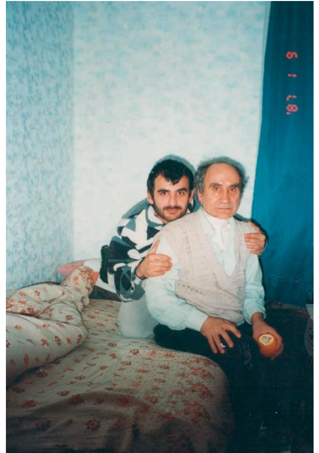
Mein Vater und ich, 1987

Meine drei Kinder und die Enkel werden in Deutschland bleiben, sie haben die deutsche Staatsangehörigkeit.“