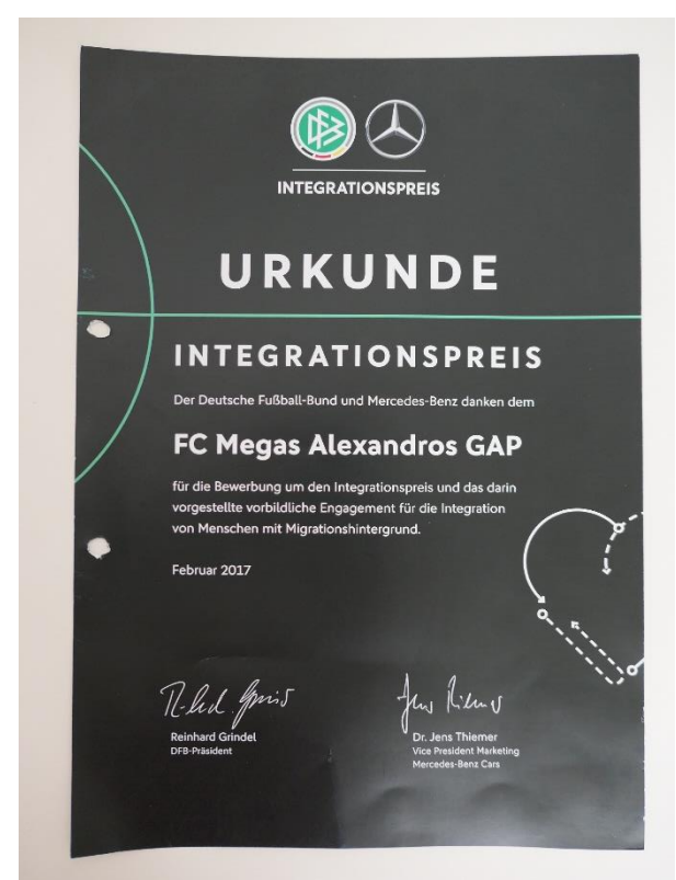
Urkunde Integrationspreis für FC Megas Alexandros GAP

verliehen vom Deutschen Fußballbund und Mercedes-Benz, Februar 2017